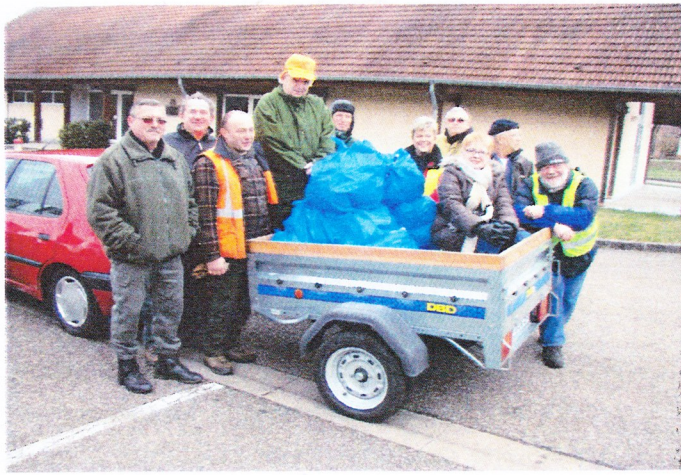
JOURNEE PROPRETE EGUELSHARDT 23 MARS 2013