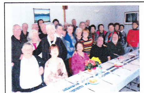
CLUB DES SENIORS