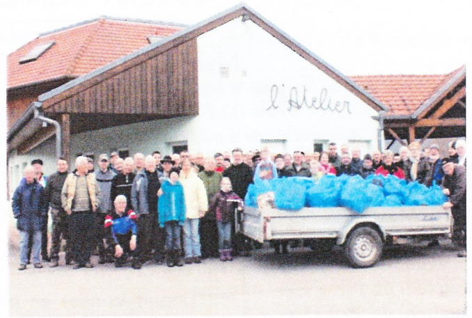
JOURNEE PROPRETE REGROUPEMENT A PHILIPPSBOURG 23 MARS 2013